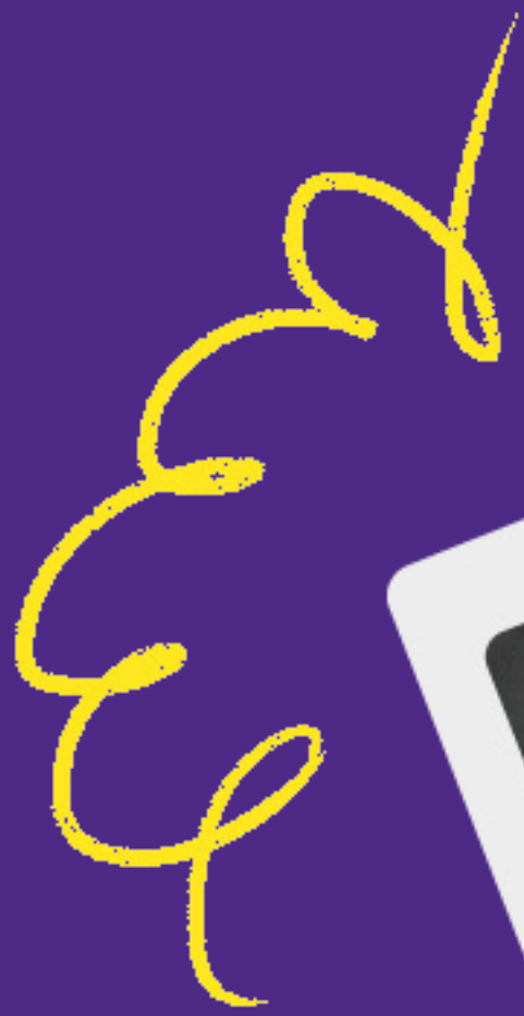
CHAÑARCILLO [1953] AUTOR: ANTONIO ACEVEDO HERNÁNDEZ DIRECCIÓN: PEDRO DE LA BARRA